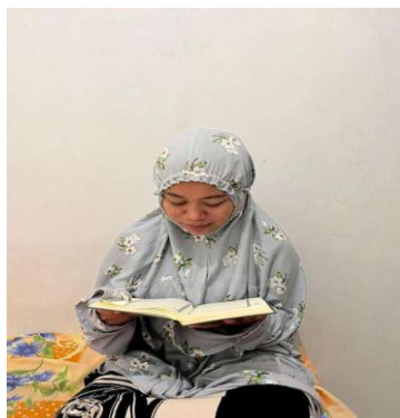
Gambar 1. Metode menghafal al-Qur'an mahasiswa PAI UIN Madura

Selain itu, mahasiswa juga ada yang menggunakan alat bantu audio visual. Nampaknya hal itu terjadi karena gaya belajar mahasiswa auditorial, sehingga lebih memilih menghafal al-qur'an dengan mendengarkan murottal al-qur'an melalui Youtube atau al-Qur'an digital.