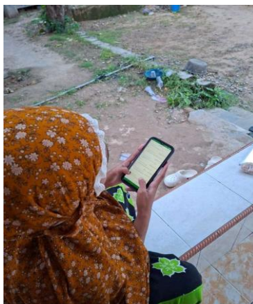
Gambar 2. Metode menghafal al-Qur'an Digital mahasiswa PAI UIN Madura

Dari beberapa data tersebut dapat diketahui bahwa mahasiswa menggabungkan metode tradisional dengan metode modern yaitu aplikasi digital. Hal ini menunjukkan bahwa dengan menggabungkan dua metode seperti menggunakan mushaf cetak dan Al-Qur'an digital akan lebih efektif bagi mahasiswa dalam menghafal dibandingkan dengan menggunakan satu metode saja. Al-Qur'an digital ini bisa digunakan di mana saja dan kapan saja, seperti saat kita berpergian tidak perlu repot untuk membawa mushaf al-Qur'an, cukup dengan menggunakan handphone, kita bisa menghafal atau muraja'ah di mana saja sehingga dapat membantu dalam mempercepat hafalan Al-Qur'an. Hal itu juga disampaikan oleh Ibu Muliatul Maghfiroh sebagai dosen pengampu tahfidz bahwa: