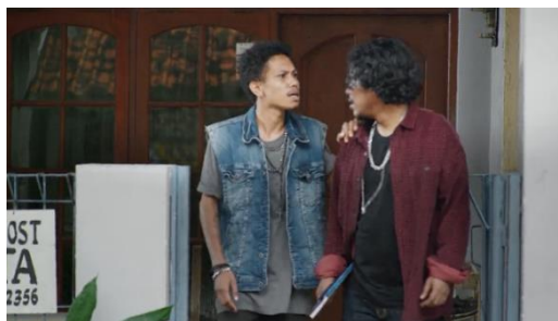
Gambar 2. Episode 1 menit ke 00:22:55

Kakak 1 : kita berdua datang ke sin ikan mau nagih utang e, harusnya kita berdua dapat uanga begitu, kenapa kita yang ngasik uang