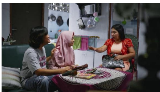
Gambar 4. Episode 1 menit ke 00:19:56

Persahabatan menjadi sebuah kata julukan yang bisa menjelaskan kerjasama dan dukungan antara manusia satu dengan yang lainnya 14 . Sahabat memperlihatkan kesetiaan satu sama lain masing-masing orang itu bahkan terkadang melupakan memperhatikan diri sendiri.