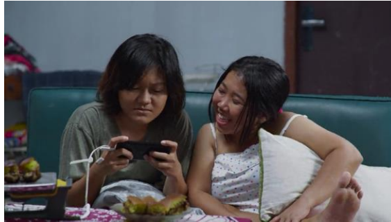
Gambar 6. Episode 1 menit ke 00:01:10

Keakraban terjalin karena adanya interaksi sosial antar manusia. Pada interaksi sosial mempunyai dua tanda yang bisa terjadinya interaksi berjalan dengan baik, yaitu pada komunikasi dan kontak social 17 . Bentuk interaksi sosial meliputi kerjasama, adaptasi, asimilasi dan akulturasi, kompetisi dan oposisi.