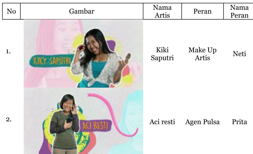
Tabel 1. pemain dalam film series Imperfect The Series

Di era digital, pastinya semua orang terhubung dengan adanya internet melalui handphone. Adanya seluruh informasi bisa bersumber dari televisi, cetak maupun online yang bisa diakses dengan mudah tanpa adanya bentuk fisik 9 . Dengan handphone masyarakat bisa menikmati siaran web series. Dikatakan web series karena penayangan film yang dibuat menjadi beberapa episode dengan durasi yang terbilang singkat dibandingkan dengan film. Durasinya hanya mencapai 15-45 menit setiap episodenya. Disini diambil salah satu web series yaitu Imperfect The Series . Series ini mengambil ide cerita dari film Imperfect yang diperankan oleh Jessica Mila dan Reza Rahardian. Dalam web series ini Reza Rahardian juga ikut main namun bukan menjadi pemeran utama melainkan tokoh anak pemilik kos yang ditempati 4 pemain utama. Berikut adalah table pemain dalam film series Imperfect The Series .