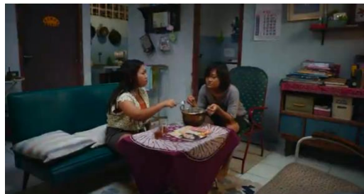
Gambar 3. Episode 2 menit ke 00:24:58