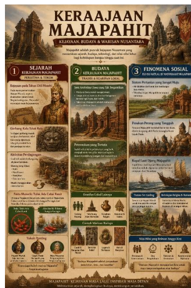
Gambar 2. Visualisasi Konten yang Dianalisis

Konten Instagram Medan Amrulloh sebagian besar disajikan dalam bentuk visual, seperti gambar, infografis, dan video pendek yang didukung oleh narasi informatif. Materi disampaikan melalui pendekatan storytelling yang mengaitkan berbagai fakta sejarah, budaya, dan fenomena sosial dengan penggunaan bahasa yang sederhana, menarik, serta mudah dipahami. Pendekatan tersebut memungkinkan audiens, terutama peserta didik, untuk memahami materi dengan lebih efektif dan menyenangkan. Pada tahap awal, dilakukan klasifikasi materi IPS. Konten yang dianalisis dapat dibagi menjadi tiga kategori utama, yaitu: (1) sejarah Kerajaan Majapahit yang mencakup peristiwa dan tokoh, (2) budaya Kerajaan Majapahit yang meliputi tradisi dan kearifan lokal, serta (3) fenomena sosial yang berkaitan dengan isu-isu aktual di masyarakat. Ketiga kategori tersebut menunjukkan adanya keterkaitan langsung dengan ruang lingkup pembelajaran IPS kelas VII semester 2, khususnya pada materi mengenal leluhur bangsa Indonesia dalam bab tentang keanekaragaman lingkungan sekitar. Berikut gambar dan penjelasan dari ketiga kategori.