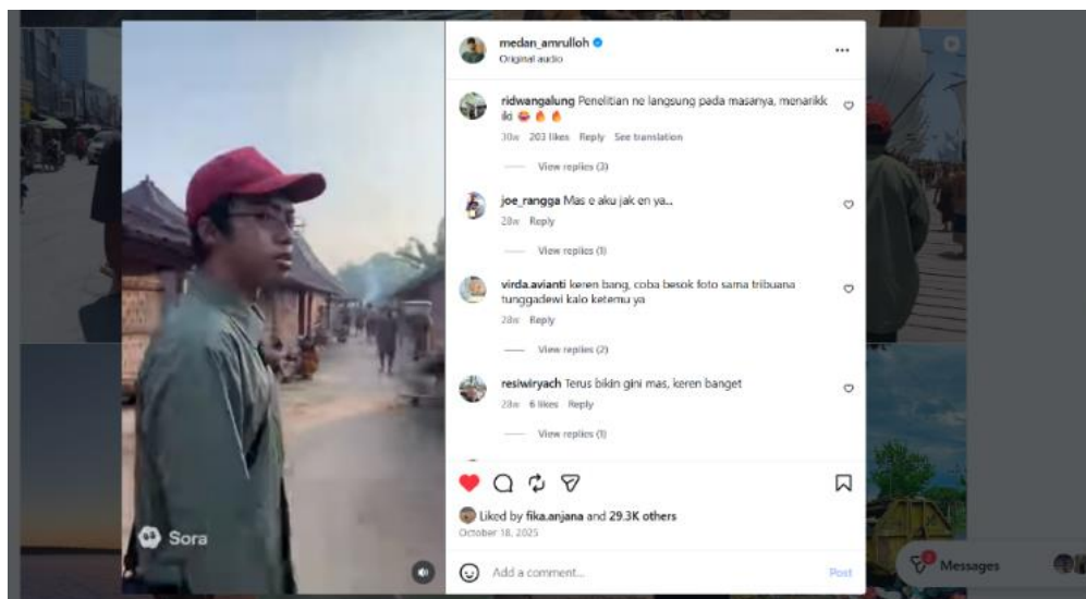
Gambar 3. Pengenalan Masa Majapahit

Mada. Ditemukan pula kapal laut Djong Majapahit kapal ini tinggi dan besar terbuat dari kayu jati Blora agar kuat menahan ombak, dengan kapal ini Majapahit menggunakan untuk berlayar menyusuri laut. Ditemukan pula taman sri gading yaitu sebuah taman untuk raja Hayam Wuruk untuk menyepi juga tempat para pujangga menulis. Kehidupan religius dan humanis sudah ada di zaman Majapahit, sinkretisasi Hindu Budha di kedaton dan koestisensi kejawen dikalangan rakyat. Berikut gambar dari konten medan Amrullah.