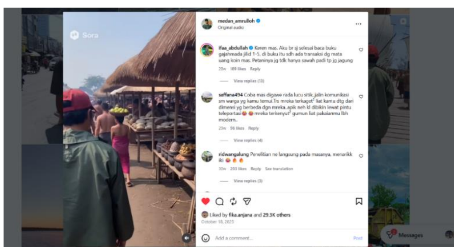
Gambar 4. Isi konten Medan Amrulloh tentang Perdagangan di Majapahit

Hasil pelaksanaan pembelajaran menunjukkan bahwa pemanfaatan Instagram melalui konten Medan Amrulloh dapat menjadi media yang efektif dalam mendukung pembelajaran IPS. Pada kegiatan awal, konten yang disajikan mampu membangkitkan perhatian dan motivasi belajar siswa. Selama kegiatan inti, siswa aktif melakukan pengamatan, analisis, serta diskusi terhadap informasi yang diperoleh dari konten Instagram, sehingga kemampuan berpikir kritis dan pemahaman mereka terhadap materi IPS semakin berkembang. Adapun pada kegiatan penutup, refleksi pembelajaran dan tanya jawab memberikan kesempatan kepada siswa untuk menguatkan pemahaman serta menyusun simpulan berdasarkan hasil belajar yang telah diperoleh. Oleh karena itu, pemanfaatan Instagram dalam pembelajaran IPS mampu meningkatkan keterlibatan siswa sekaligus menghadirkan pengalaman belajar yang lebih menarik, kontekstual, dan adaptif terhadap era digital. Berikut di sajikan gambar konten Medan Amrulloh tentang perdagangan di Majapahit.